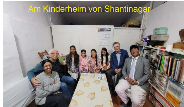
Am Kinderheim von Shantinagar